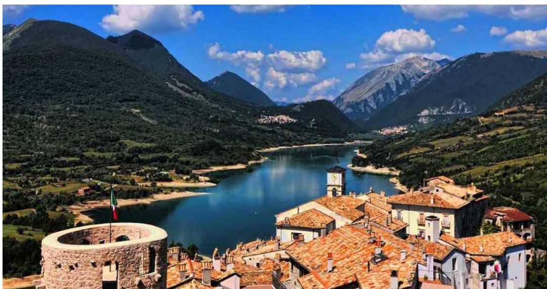
Il suggestivo lago di Barrea