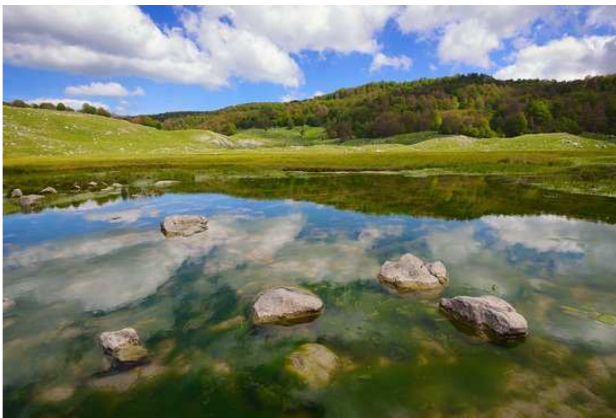
La spettacolare conca del Lago Vivo