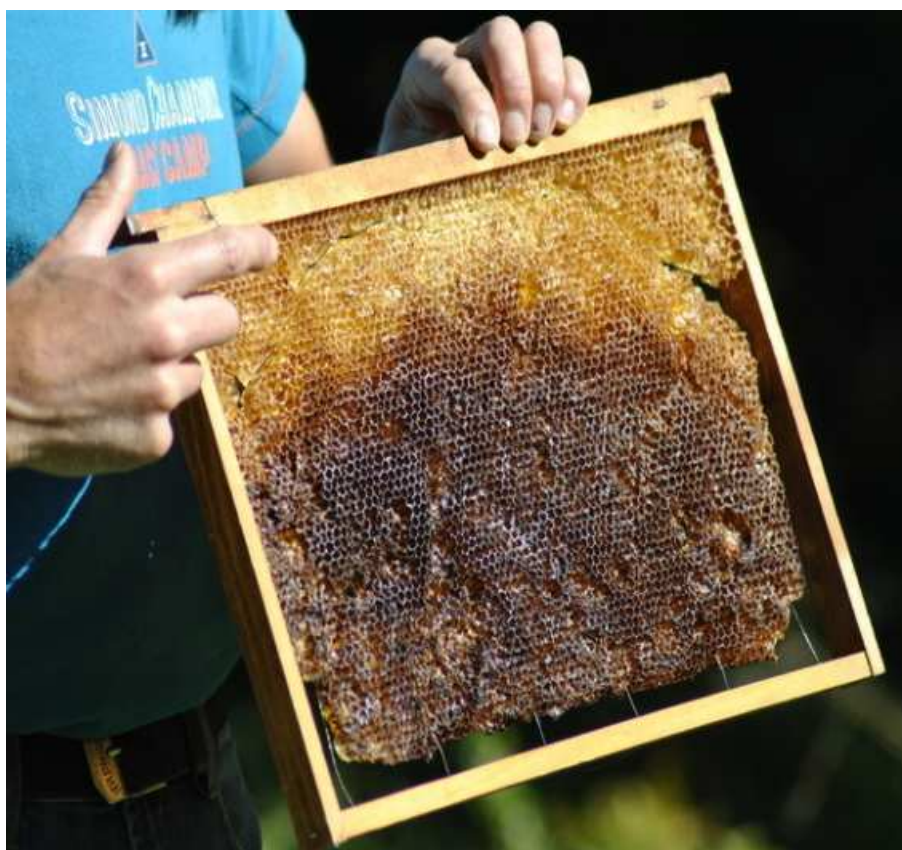
La matematica delle api

Spostamento a Barrea e gita a Lago Vivo, situato in una impressionante conca circondata da un panorama mozzafiato, dominato da alcune delle vette più imponenti del Parco.